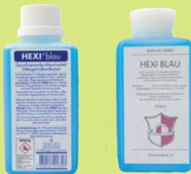
Hexi blau desinfizierendes Waschmittel

diacosa pharma kosmetik CH-Burgdorf diacosa pharma Onlineversand, 3400 Burgdorf 5.7.2014 / CHF 6.20