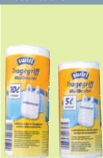
Swirl Tragegriff Müllbeutel antibakteriell 40 Stück à 5 l bzw. 37 Stück à 10 l

Melitta Europa GmbH & Co KG, D-32427 Minden www.maxmona.ch c/o e+h Services AG, 4658 Däniken 7.5./19.6.2014 / CHF 2.50