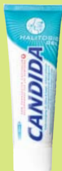
Candida Halitosis Gel Zahnpasta 75 ml

Purity Laboratories GmbH IRL-Dublin Push Dental My Trade CH GmbH, 8910 Alfoltern a. Albis 8.7.2014 / CHF 5.70 Verkauf via ZahnärztInnen