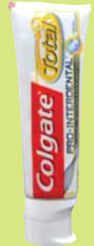
Colgate Total Pro Interdental Zahnpasta 75 ml

Colgate-Palmolive USA-New York Coop 4001 Basel 2.8.2014 / CHF 3.00