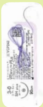
Ethicon Vicryl Plus Antibacterial 90 cm Faden